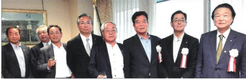
▲ちんたい政治連盟の執行部の皆様