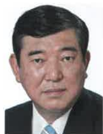
石破 茂 自民党賃貸住宅 対策議員連盟会長

政府は2020年東京オリンピック開催までに訪日外国人観光客4000万人を目標としており、急増する訪日